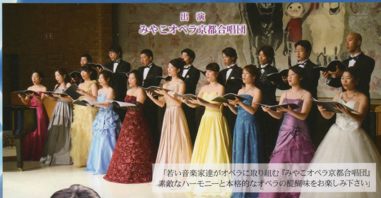
出演 みやこオペラ京都合唱団

「若い音楽家達がオペラに取り組む『みやこオペラ京都合唱団』 素敵なハーモニーと本格的なオペラの醍醐味をお楽しみ下さい」